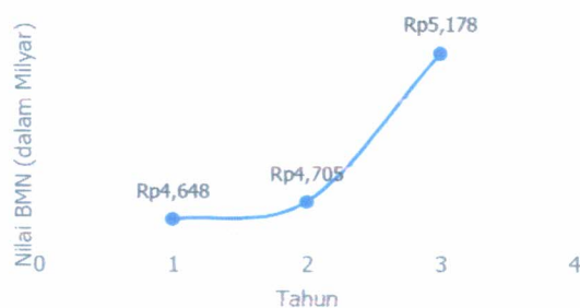
Perkembangan Nilai BMN Tahun 2023 s.d. 2025

Kenaikan nilai berdasarkan pembelian BMN berupa peralatan dan mesin untuk mendukung pelaksanaan tugas sehari-hari, sehingga terjadi kenaikan yang cukup signifikan nilai BMN tahun 2025.